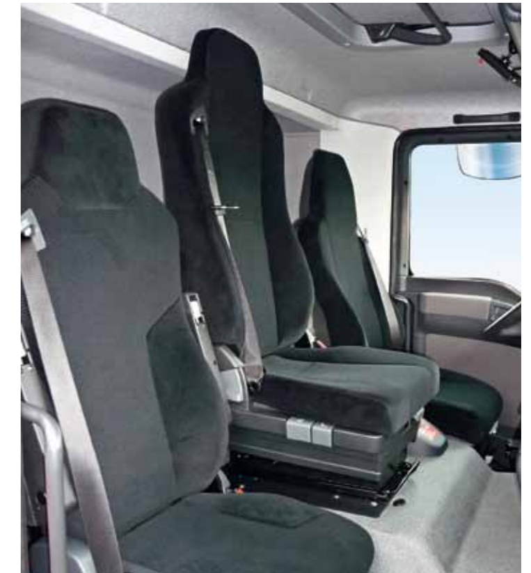
Luftgefederter, verstellbarer Mittelsitz mit integriertem 3-Punkt-Gurtsystem.