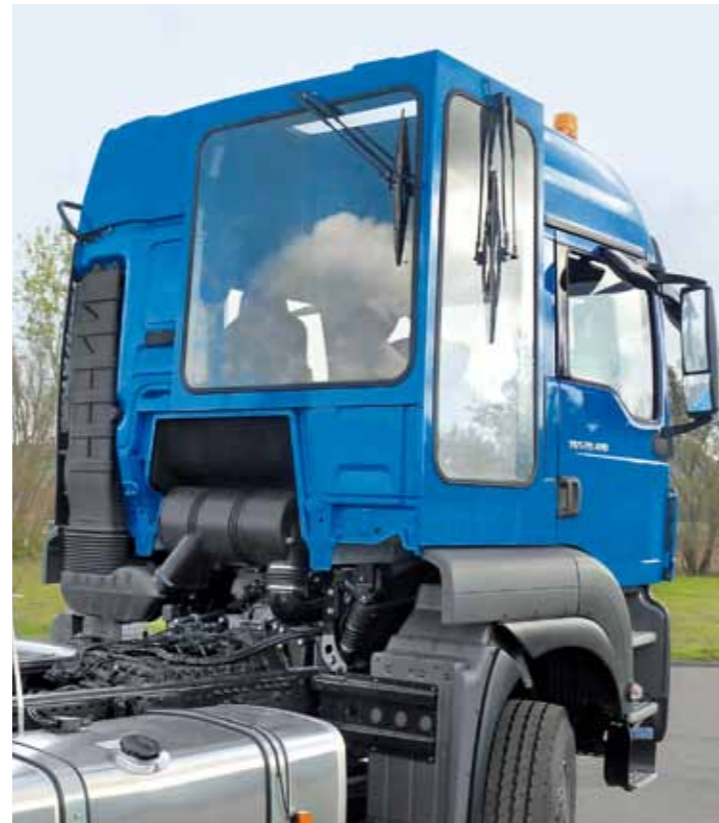
Fahrerhaus mit Seiten- und Rückwandverglasung.

Im breiten Spektrum der kommunalen Aufgaben gibt es eigentlich nichts, was unsere Fahrzeuge nicht leisten könnten. Selbst für speziellste Anforderungen haben wir eine Lösung: Das MAN Modification Center setzt individuelle Sonderwünsche professionell und technisch perfekt um. Eine fast grenzenlose Vielfalt an Fahrzeugmodifikationen ist möglich. Ob Fahrerhaus, Fahrgestell, Antriebsstrang, Elektronik oder Aufbau: Maßgeschneiderte Lösungen werden nicht nur für spezifische Einzelanforderungen realisiert, sondern auch für das komplette Fahrzeug.