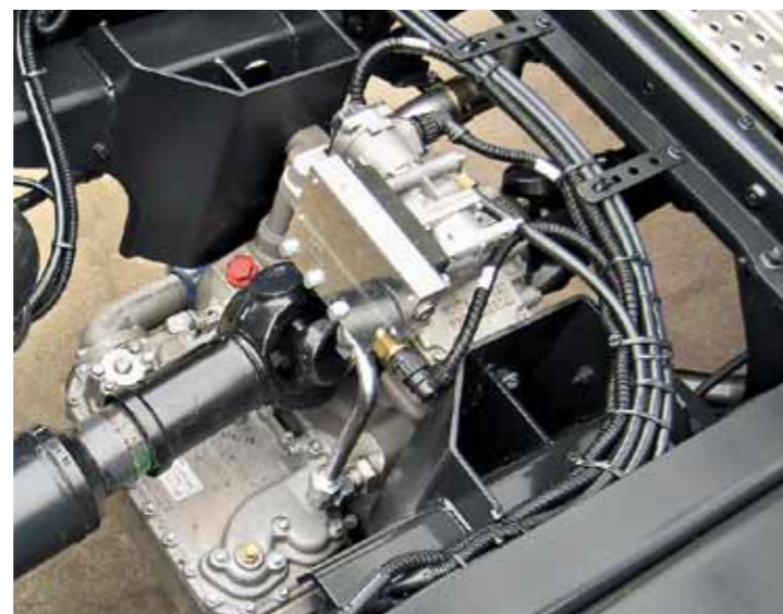
Retarder für MAN TGM.