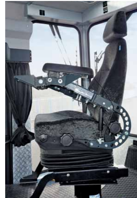
Drehsitz mit Steuerelementen.