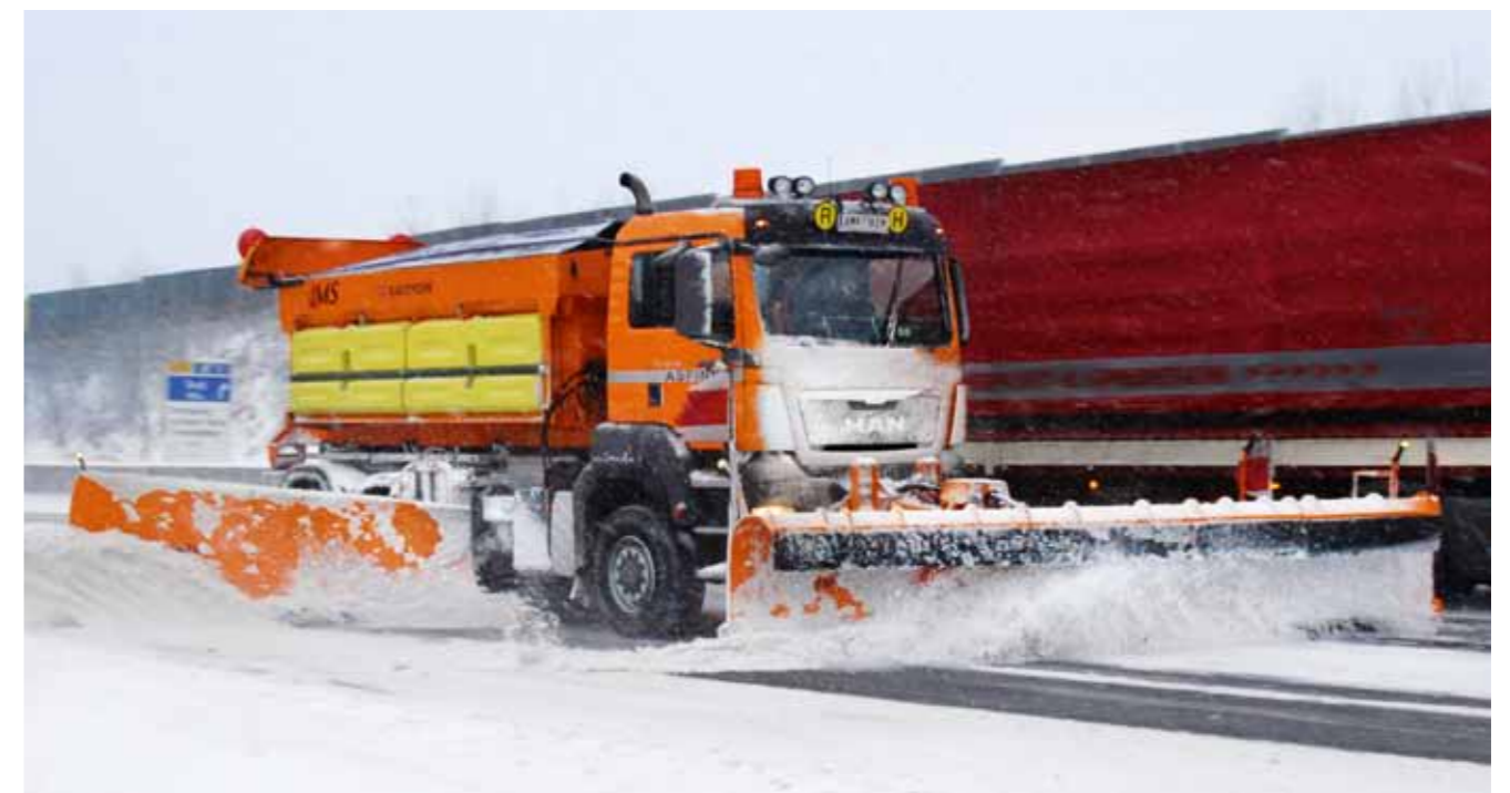
Genormte Anbauplatte für Vorbaugeräte auf Wunsch.

Im Streueinsatz spielen die blatt-/luftgefederten Dreiseitenkipper ihre Stärken aus: Durch die Luftfederung bleibt die Ladeflächenhöhe immer gleich, unabhängig von der Beladung. Das bringt ein konstantes Streubild während der gesamten Einsatzfahrt. Eine einzigartige Kombination in der Klasse der 13-Tonner ist der MAN TGM als 4x4-Fahrgestell mit Blatt-/Luftfederung.