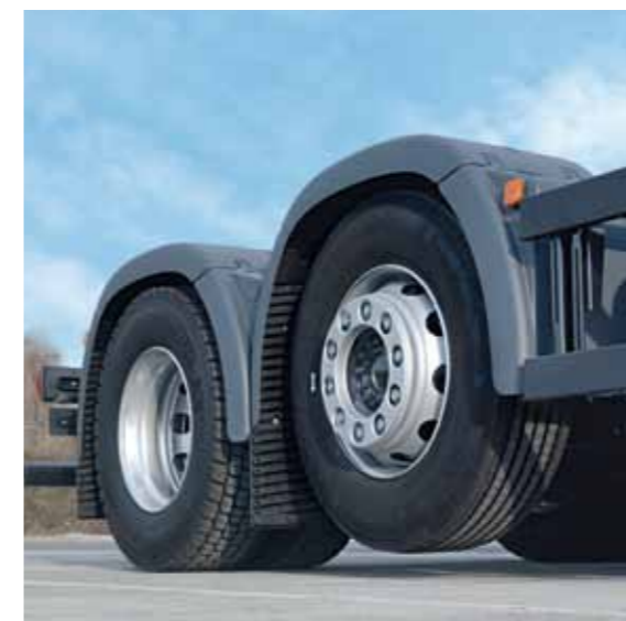
Liftbare und gelenkte Vorlaufachse bei MAN TGM.