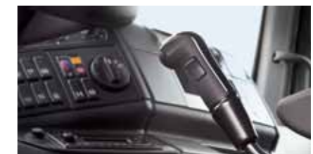
Praktisch, ergonomisch, gut. Bedienelement für Abfallsammelfahrzeuge.