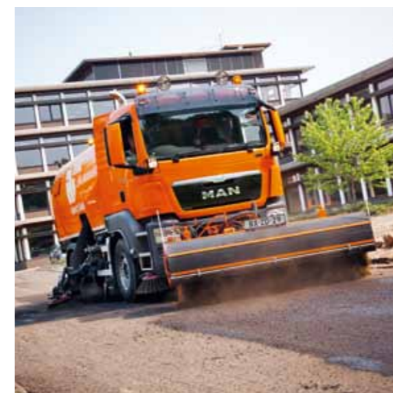
Wechselsystem für TGM.